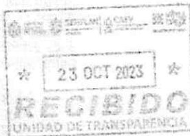
Ilustración 1 Extracto del Oficio SOM/7C5/2015/2023 de fecha 18 de octubre de 2023, firmado por el Subdirector de Operación y Mantenimiento

Expediente y consecutivo. COLNEGR/JLAR/ggm OFICINA DE USO EFICIENTE DEL AGUA