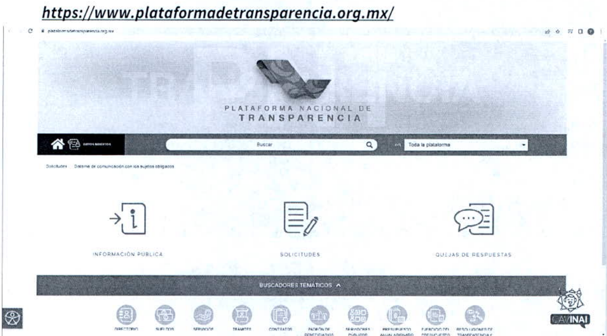
Imagen 1 del sitio de la Plataforma Nacional de Transparencia, al cual redirige el vínculo proporcionado por la autoridad responsable.

Es así, que en razón de la respuesta proporcionada el ahora recurrente estableció como agravio el hecho que la información no se encontraba es omisa y que no hay links electrónicos directos , motivo por el cual el Comisionado Ponente determino realizar la inspección al mismo obteniendo lo siguiente: