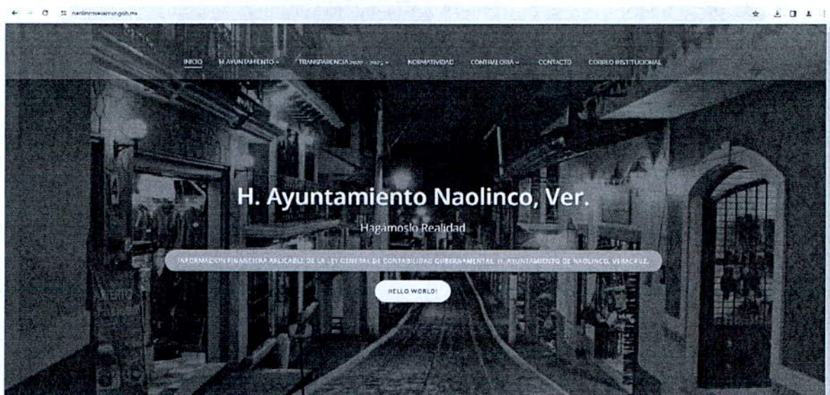
Imagen 2 del sitio del Portal institucional del Ayuntamiento de Naolinco, al cual redirige el segundo vínculo proporcionado por la autoridad responsable.