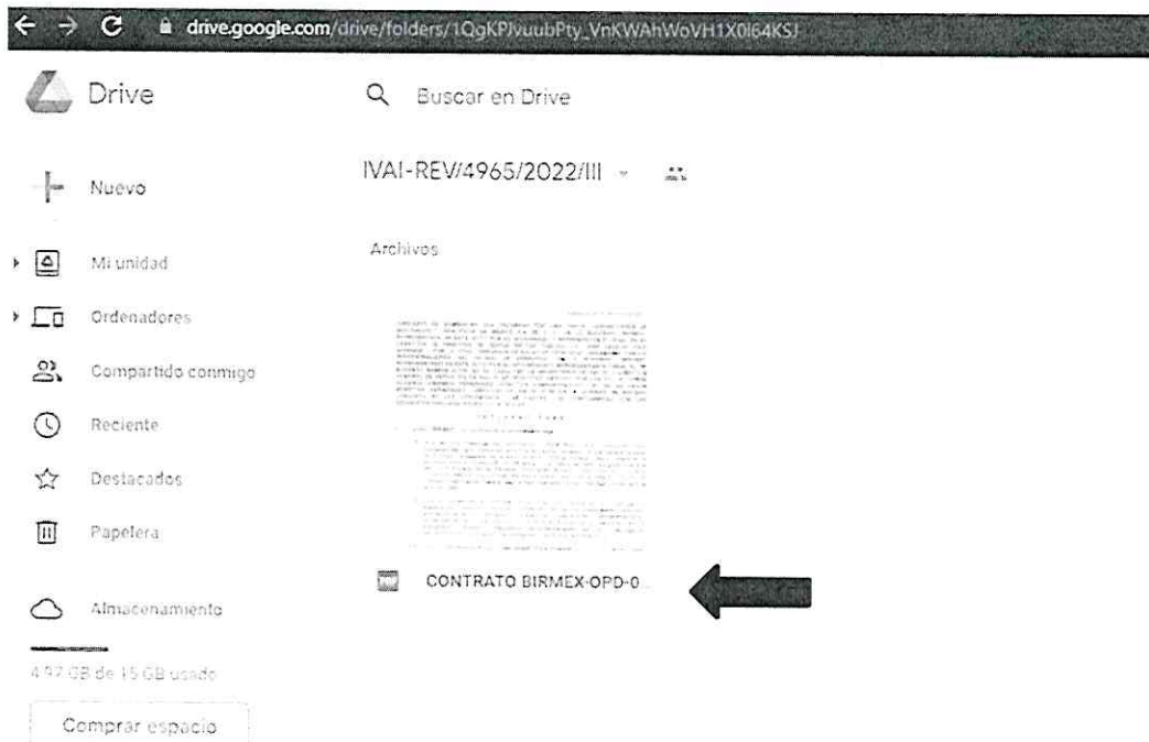
Captura de pantalla 6 de la consulta realizada al hipervínculo: https://drive.google.com/drive/folders/1QgKPJvuubPty_VnKWAhWoVH1X0i64KSJ

40. Ahora bien, este Instituto percata que los agravios expuestos devinieron, en primera instancia, de una inconformidad de la recurrente con la inaccesibilidad de la información; lo anterior debido a que la autoridad manifestó poner a su disposición información relativa a la adquisición de vacunas contra la fiebre amarilla durante el año dos mil veinte y sin realizar una mayor manifestación respecto al resto del contenido de la solicitud.