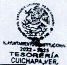
Ilustración 1 Extracto del oficio T.M./0019/2022 de fecha 01 de diciembre de 2022 signado por el Tesorero Municipal