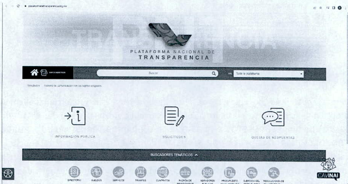
Imagen 1 del sitio de la Plataforma Nacional de Transparencia, al cual redirige el vinculo proporcionado por la autoridad responsable.

https://www.plataformadetransparencia.org.mx/web/guest/inicio