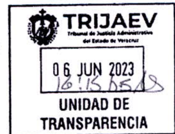
Ilustración 1 Extracto del Oficio TRIAJEV/DA/163/2023 de fecha 05 de junio de 2023