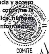
Ilustración 1 Acta de Primera Sesión Extraordinaria