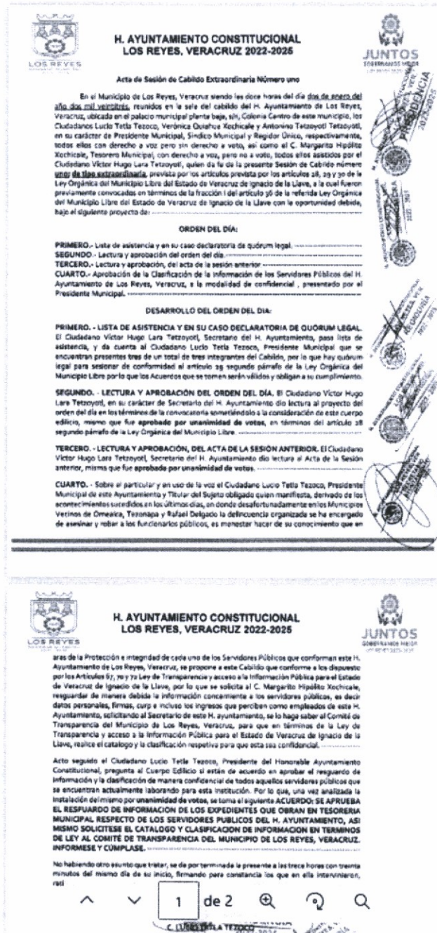
Ilustración 3 Contenido del enlace electrónico:

https://1drv.ms/b/s!AiQxRVk8Kbh2qgwpSvy7V49eVucG?e=yizqTi