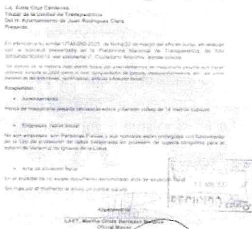
Extracto del oficio UTAI-069-2023 , de fecha 28 de abril del 2023, suscrito por el Titular de la Unidad de Transparencia.

Por lo antes expuesto, se dirige oficio a la unidad administrativa de Oficialia Mayor misma que responde a esta Unidad de Transparencia se adjunta Oficio No. OFM-127-2023, de fecha 12 de abril del corriente; signado por el Titular del área.