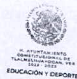
Ilustración 1 Del oficio AYTO/TLAL/EYD/01/2023 de fecha 04 de enero de 2023, signado por el Titular de educación y Deporte