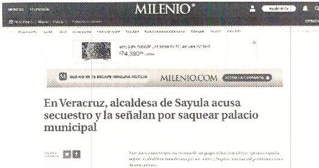
Captura de pantalla 1 de la inspección realizada al enlace electrónico: https://www.milenio.com/policia/alcaldesa-sayula-aleman-logro-division-pueblo proporcionado por el particular en su solicitud de acceso a la información. Consultado el día 03 de noviembre de 2022.