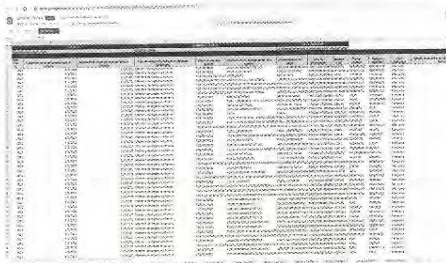
Captura de pantalla 7 de la inspección realizada a la dirección URL: https://docs.google.com/spreadsheets/d/1h7h87dF7d5bgNOKUI5BrVU6h49NzRLB/edit#gid=1032553513 el 14 de febrero de 2022.