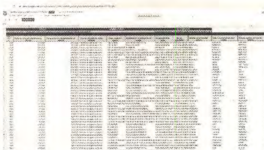
Captura de pantalla 4 de la inspección realizada a la dirección URL: https://docs.google.com/spreadsheets/d/1y8HG1Ehd8h2_mUH5j2wlc3Jn9RW47r5E/edit#gid=97761126 el 14 de febrero de 2022.