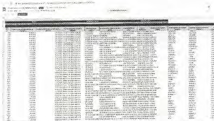
Captura de pantalla 6 de la inspección realizada a la dirección URL: https://docs.google.com/spreadsheets/d/1sm4yQeRsKdCbav2aByrfeO-WwqWcgmU/edit#gid=1093857202 el 14 de febrero de 2022.