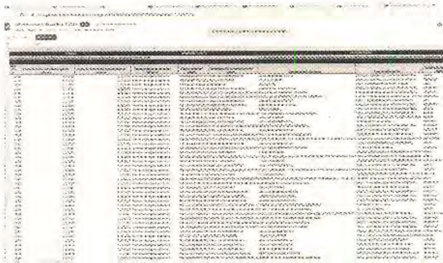
Captura de pantalla 3 de la inspección realiza a la dirección URL: https://docs.google.com/spreadsheets/d/14fqg6ssVYSiLEv4cMEdH3WHcF1DX0B5/edit#gid=1145911476 el 14 de febrero de 2022.