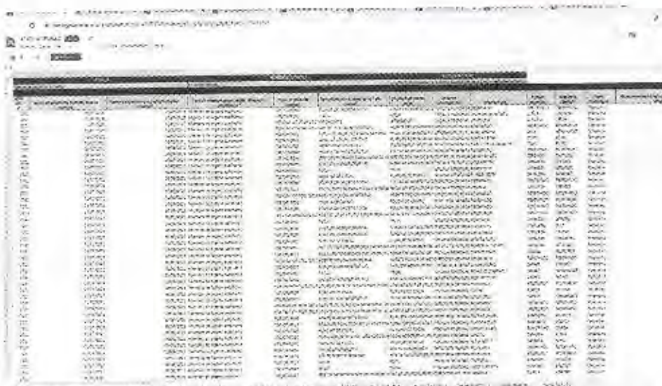
Captura de pantalla 1 de la inspección realizada a la dirección URL: https://docs.google.com/spreadsheets/d/1Aj_e4I97TNFnvohevdpS_LDlBczx1hjQ/edit#gid=1980113253 el 14 de febrero de 2022

33. Como resultado de dicha diligencia, este Órgano Garante, pudo constatar que al momento de ingresar los enlaces electrónicos en el navegador web del ordenador, estos dirigían a los documentos que señaló la autoridad responsable en su comparecencia, así como en la respuesta primigenia. Para mayor ilustración, se insertan capturas de pantalla de las inspecciones realizadas por esta Ponencia, en el orden en que fueron enlistados los hipervínculos en el párrafo 32 de este fallo: