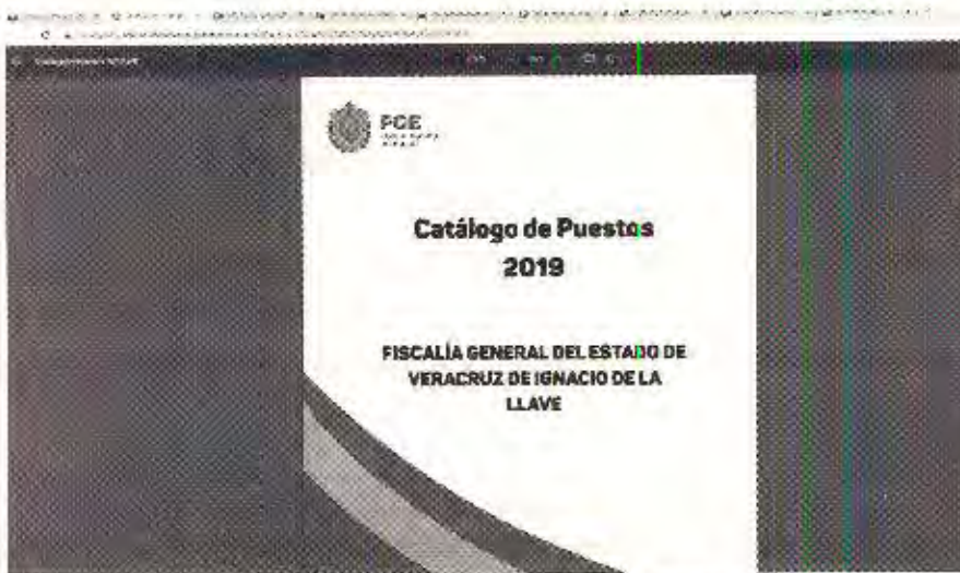
Captura de pantalla 2 de la inspección realizada a la dirección URL: http://ftp2.fiscaliaveracruz.gob.mx/recursos%20humanos/02_EstOrq/2021/Cat%C3%A1logoDePuestos%202019.pdf el 14 de febrero de 2022