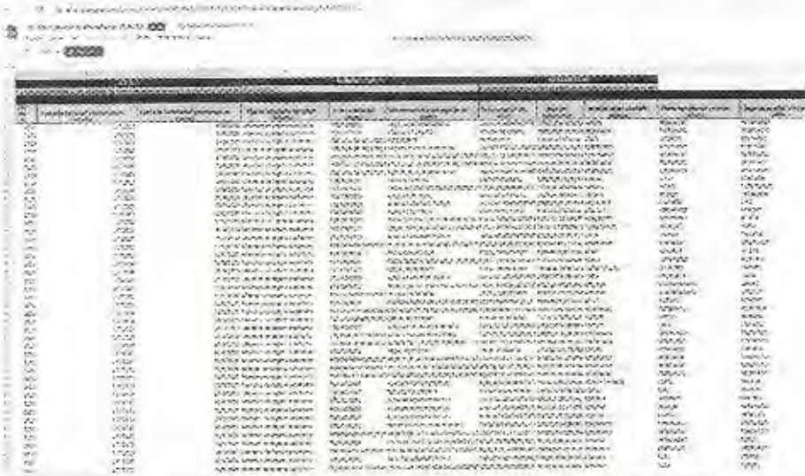
Captura de pantalla 5 de la inspección realizada a la dirección URL: https://docs.google.com/spreadsheets/d/1IHJkWW6ARk46w4SONFla8vAhx6gdh9n/edit#gid=68577879 el 14 de febrero de 2022.