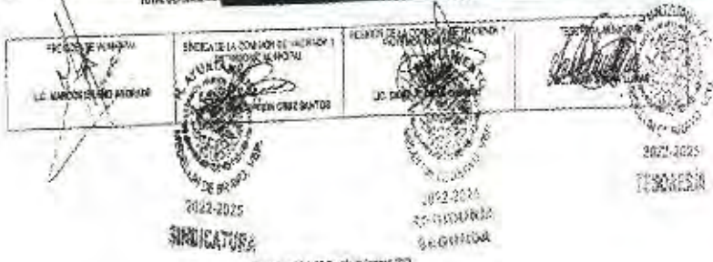
Figura 1.3.2.1.1. Hoja de Personal (1/1)